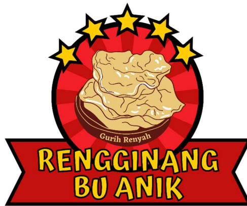
Gambar 1. Logo Rengginang Bu Anik

agar mitra bisa membranding UMKM nya dengan gaya sesuai era yang sedang berjalan saat ini yaitu era industri 4.0 yang memiliki banyak pembanding visualisasi dari pesaing dalam usahanya. Menurut Wastutiningsih dan Dewi (2019) Upaya branding secara digital di era industri 4.0 penting dilakukan karena di era ini masyarakat dihadapkan dengan kehidupan yang menuntut penggunaan internet sebagai alat yang mempermudah segala hal. Sebelum pembuatan logo dilakukan audiensi untuk menentukan gaya yang diminati oleh pelaku usaha karena hal tersebut berkaitan dengan identitas Rengginang Bu Anik.