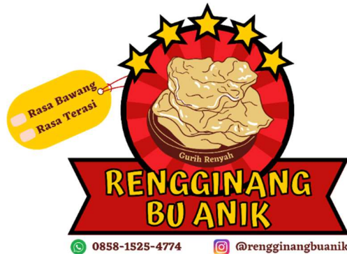
Gambar 2. Stiker Produk Rengginang Bu Anik

Bentuk visual yang dipilih untuk mewakili Rengginang Bu Anik dalam bentuk logo menjadi solusi yang ditawarkan oleh pelaksana, Logo yang telah dibuat akan ditambahkan varian rasa rengginang agar mudah untuk dikenali dan terdapat pembeda dari satu rasa dengan rasa yang lain serta akan ditambahkan informasi nomor whatsapp dan akun instagram agar dapat terhubung langsung dengan Bu Anik sebagai penjual Rengginang walau terbatas ruang dan waktu.