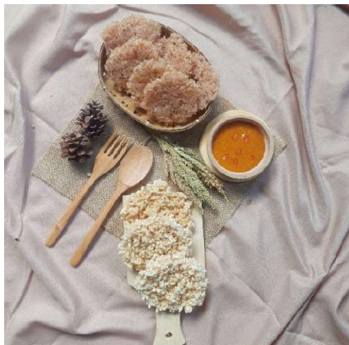
Gambar 4. Foto Produk Rengginang Bu Anik Ukuran Kecil

Foto Produk Rengginang Bu Anik Ukuran Kecil seperti pada Gambar 3 merupakan salah satu solusi yang ditawarkan pada mitra kegiatan PKM ini dan nantinya gambar ini akan digunakan juga dalam media promosi berbasis digital pada media sosial. gambar Rengginang Bu Anik ukuran kecil ini ingin menampilkan keautentikan dari produk yang dihasilkan oleh mitra. pemilihan warm tone dengan perpaduan besek, kain goni dan talenan menyampaikan bahwa produk yang dihasilkan oleh mitra ini diproduksi dengan cara yang sederhana dan asli seperti dizaman dahulu serta melewati proses penjemuran secara manual menggunakan besek.