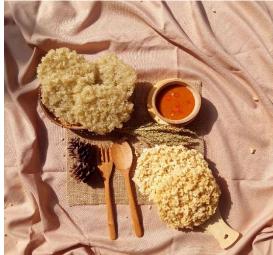
Gambar 5. Foto Produk Rengginang Bu Anik Ukuran Besar

produk sebelum digoreng serta menampilkan rengginang yang sudah matang agar konsumen dapat membayangkan tampilan produk setelah digoreng. elemen sambal digunakan dalam menarik minat dan keinginan calon konsumen untuk membeli produk dan memberikan kesan cantik serta lezat pada foto produk yang telah berhasil dilakukan.