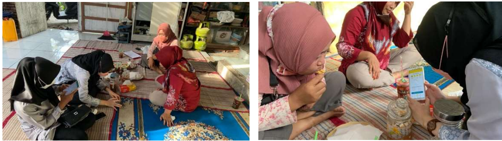
Gambar 3. Pendampingan Manajemen Keuangan menggunakan Aplikasi BukuKas