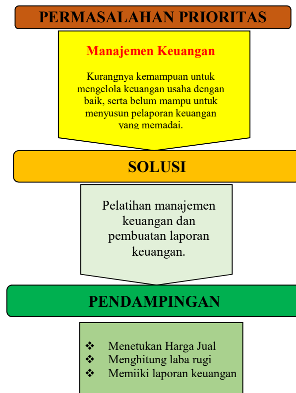
Gambar 1. Gambar Permasalahan dan Solusi yang Ditawarkan

Berdasarkan permasalahan yang dihadapi Mitra, dalam hal ini adalah kelompok usaha UMKM Kelurahan Sidowayah, maka solusi yang ditawarkan oleh Tim Pengabdian STIE YPPI Rembang untuk menyelesaikan masalah bisa dilihat dalam gambar berikut: