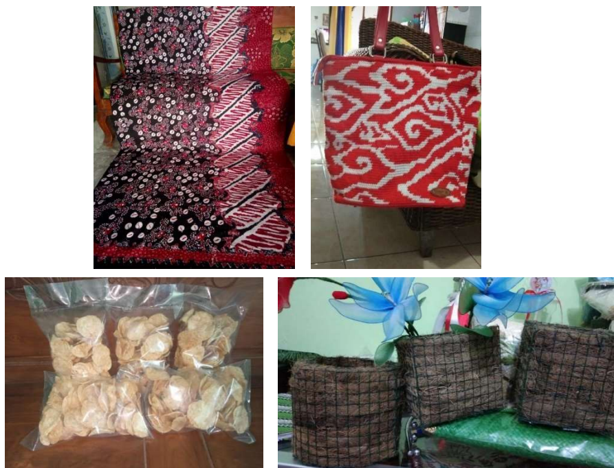
Gambar I.1. Produk UMKM Kelurahan Sidowayah

Salah satu UMKM yang ada dalam kelompok tersebut adalah usaha yang bergerak di bidang pengrajin batik "Sekar Langgeng" yang memproduksi kain batik tulis dan juga cap, dan juga menjual tas, masker dari bahan batik. Selain itu juga ada UMKM yang membuat pot dari sabut kelapa yang dikelola oleh Bapak Aditya. Dengan memanfaatkan sabut kelapa yang dikreasikan menjadi salah satu media tanam yang unik dan sangat bersahabat dengan lingkungan. Ada pula UMKM yang membuat makanan ringan seperti keripik tempe yang dikelola oleh Bapak Dwi yang bertempat tinggal di Kelurahan Sidowayah RT03/RW03. UMKM yang tergabung dalam kelompok ini ada 6 UMKM yang bergerak di bidang yang berbeda-beda.