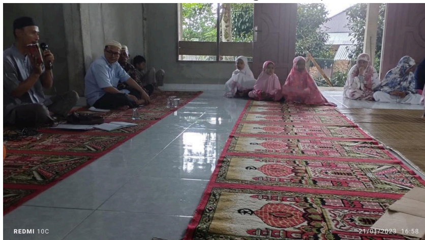
Gambar 5. Penyampaian Ide dan Gagasan Mengenai Pembangunan Desa Oleh Salah Seorang Tokoh Masyarakat