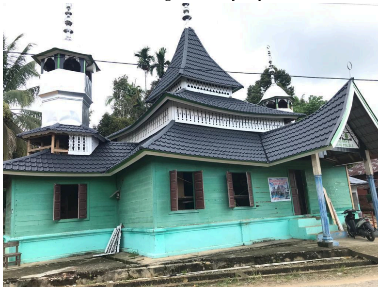
Gambar 4. Hasil Perbaikan Bangunan Masjid Lama