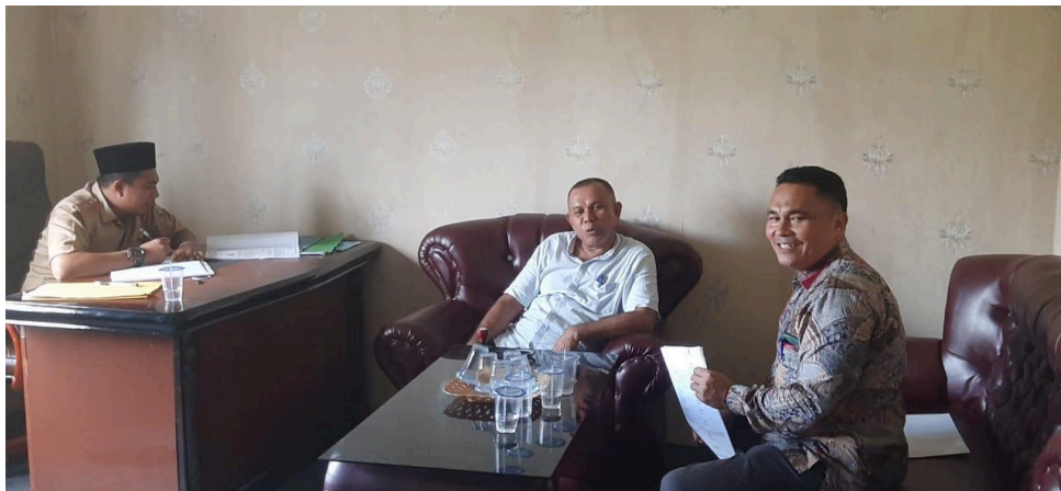
Gambar 1. Survei awal ke Lapangan sebelum Pengabdian Sekaligus Silaturahmi dengan Salah Kepala Desa Candi Muara Takus

Agar kontribusi tokoh Masyarakat semakin jelas dan terukur maka kedepan setiap dusun mengusulkan program masing-masing ke aparat desa setelah berbincang dengan tokoh Masyarakat di dusun masing-masing. Selanjutnya kepala desa memilih program dan atau kegiatan yang dianggap penting dan mendesak serta menjadi skala prioritas sesuai usulan dari dusun-dusun tersebut. Di kawasan Kecamatan XIII Koto Kampar Potesi, warga desa rata-rata memiliki kebun sawit. Namun terdapat juga Masyarakat yang bekerja sebagai nelayan, tambak menghasilkan ikan sungai segar dan diolah menghasilkan ikan salai dan ikan asin. Warga desa juga membutuhkan pelatihan membuat cinderamata untuk mendukung program desa wisata dan pelatihan mengelola makanan khas desa yang belum berkembang selama ini.