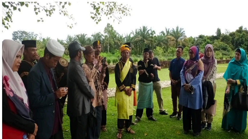
Gambar 2. Mendengarkan Aspirasi Dari Salah Seorang Tokoh Adat Masyarakat XIII Koto Kampar