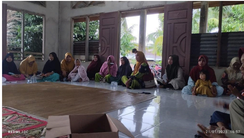
Gambar 3. Mendengarkan Penyampaian Materi