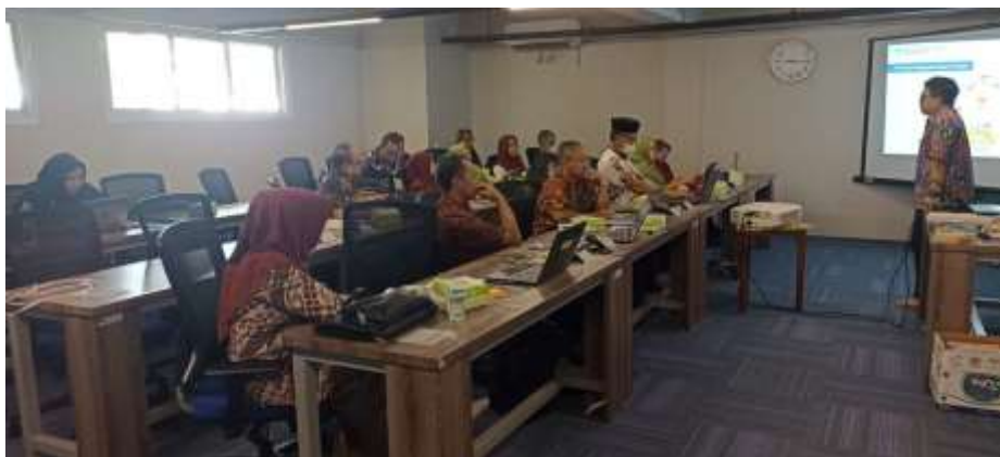
Gambar 2. Penyampaian materi oleh narasumber

Berdasarkan garfik di atas menunjukkan bahwa 83% peserta dari 24 peserta yang berasal dari mitra antusias dalam memperhatikan penyampaian materi oleh narasumber. Sedangkan 75% peserta menunjukkan keaktifan mengajukan pertanyaan, dan 87.5% peserta menyatakan bahwa mereka mampu untuk memahami materi yang disampaikan oleh narasumber. Untuk pendampingan dilaksanakan setelah kegiatan pelatihan. Pendampingan pasca pelatihan dilakukan melalui WhatsApp. Penggunaan WhatsApp dilakukan agar pendampingan ini dapat dilakukan dalam jangka yang cukup panjang, dan tidak mengandalkan kegiatan pertemuan tatap muka, sehingga tidak terbatas pada kegiatan itu saja, dan mitra dapat berdiskusi kapan pun dan dimana pun melalui WhatsApp.