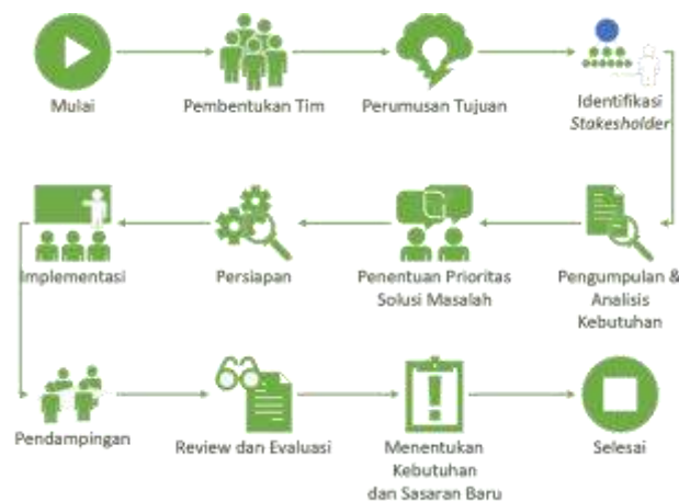
Gambar 1. Tahapan melaksanakan Pengabdian menurut Rhonda dan Pittman dalam Aribowo (9)

Pelaksanaan kegiatan ini didasarkan pada tahapan kegiatan pengabdian seperti diagram alur di bawah. Pelaksanaan dengan metode di bawah dipopulerkan oleh Rhonda, P. dan Pittman, R. H. dalam An Introduction to Community Development (Second Edition.). New York: Routledge (8).