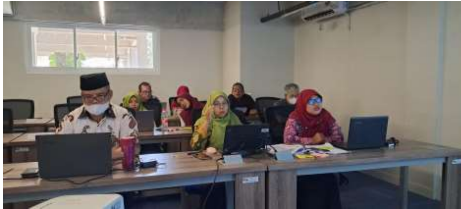
Gambar 3. Peserta kegiatan