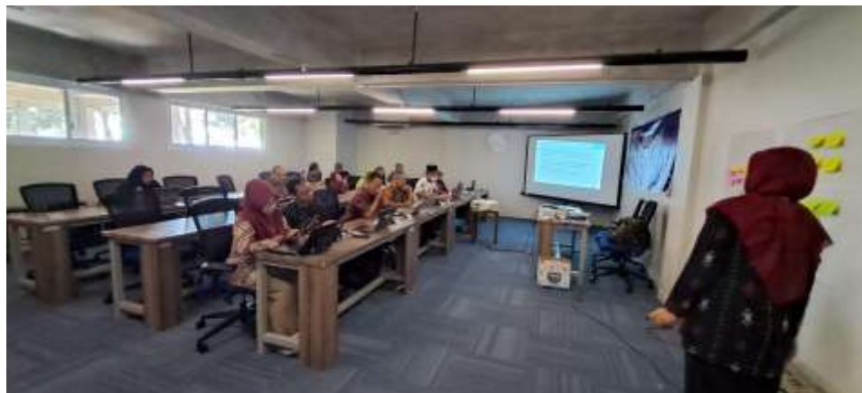
Gambar 4. Peserta pengabdian yang sedang menyampaikan hasil pembuatan modul ajar fase F

Kemudian untuk memperoleh respon peserta terhadap kegiatan pelatihan dan kegiatan pengabdian secara keseluruhan, peserta diberi angket yang berisi 10 pertanyaan/ pernyataan terkait keberbanfaatan kegiatan yang diisikan secara online oleh peserta. Berikut hasil angket tersebut.