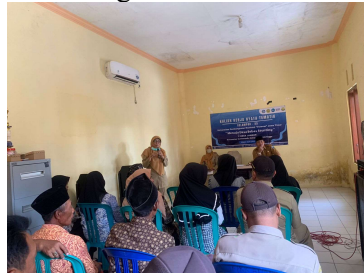
Gambar 3. Sesi Sharing Session Bersama Petugas Sanitasi