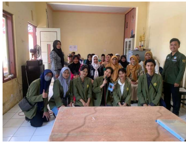
Gambar 5. Sesi Foto Bersama