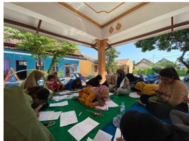
Gambar 2 Update Peta ODF 2023 Bersama Kader di Balai Desa Jangur