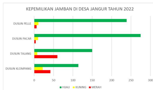
Tabel 1. Data Kepemilikan Jamban Di Desa Jangur Tahun 2022

Setelah melakukan pembaharuan peta ODF 2023, dapat diklasifikasikan terkait kepemilikan jamban di beberapa dusun di Desa Jangur. Desa Jangur sendiri, terdiri dari 16 RT dan 4 RW yang tersebar di 4 Dusun, diantaranya adalah Dusun Pelle, Dusun Talang, Dusun Pacar, dan Dusun Klompang. Berikut adalah data ODF pada tahun 2022 dan 2023 :