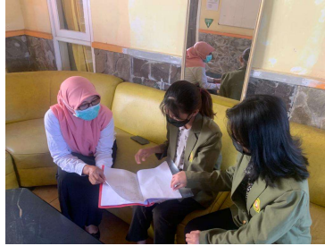
Gambar 1. Koordinasi Bersama Petugas Sanitasi