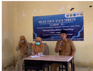
Gambar 4. Kepala Desa Berkomitmen Menjadikan Desa Jangur Menjadi Desa ODF