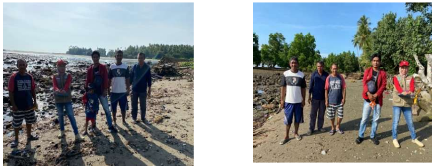
Gambar 3 Dokumentasi Tim Surveyor Pengabdian Masyarakat dengan Masyarakat Desa Patande

Pelibatan masyarakat dalam pembangunan desa dalam masa saat ini adalah penting terutama dalam aspek pemeliharaan hasil pembangunan yang sudah dibangun oleh pemerintah. Dengan adanya pelibatan dan partisipasi masyarakat maka diharapkan akan mampu menumbuhkan kepentingan bersama sebagai peningkatan rasa seseorang dalam bertanggung jawab terutama terhadap hasil pembangunan yang sudah dibangun oleh pemerintah [13] [14]