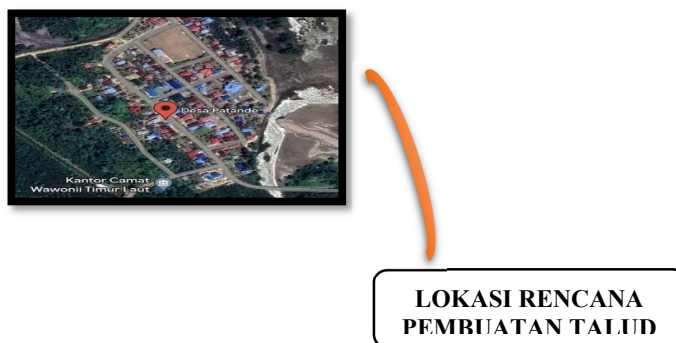
Gambar 1 Peta Lokasi Rencana Pembuatan Talud Pengaman Pantai Desa Patande

Peta Lokasi Talud Pengaman Pantai Eksisting beserta rencana pembuatan talud dapat dilihat pada Gambar 1.