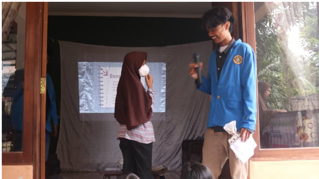
Gambar 5. Games Membaca Puisi