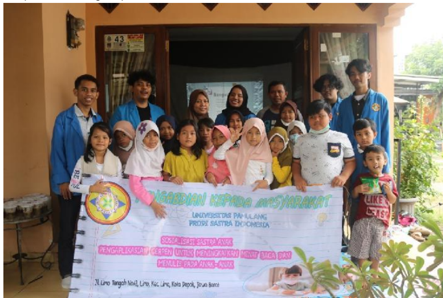
Gambar 7. Foto Bersama peserta PKM dan ketua RT Lingkungan 04 RW 03

Kelompok PKM membuat permainan yaitu menulis kenangan singkat tentang pengalaman anak atau berbagai cerita yang dapat dikarang. Dalam permainan ini kami lebih memilih untuk melatih kreatifitas anak agar mampu membuat cerita dengan cepat kemudian kami meminta para remaja untuk maju dan mempelajari cerita tersebut.