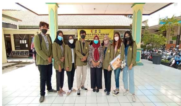
Gambar 1. Kegiatan Observasi Oleh Mahasiswa KKNT 74

Berdasarkan hasil observasi, diperoleh informasi bahwa di Kelurahan Banjar Sugihan terdapat beberapa UMKM yang mengolah produk kelor seperti Teh Kelor dan Masker Kelor. Selain itu, banyak masyarakat yang berinovasi menjadikan kelor sebagai olahan makanan maupun minuman, seperti puding kelor, Tumis Kelor, Sushi kelor dan sebagainya. Hal ini mengindikasikan bahwa Kelurahan Banjar Sugihan berpotensi dalam pengembangan suatu potensi wilayah sebagai tempat wisata. Perlu adanya pemanfaatan digital marketing untuk membranding wilayah ini menjadi kampung kelor. Berdasarkan permasalahan yang dihadapi oleh mitra, maka dalam kegiatan pengabdian masyarakat ini, ditawarkan solusi untuk branding kampung kelor sebagai desa wisata belanja terkait produk kelor. Kegiatan yang dilakukan berupa branding wisata belanja kampung kelor, mulai dari pembuatan akun sosial media, Sosialisasi mengenai digital marketing, pembentukan pengurus e-commerce dan juga implementasi berupa pelatihan digital marketing secara langsung.