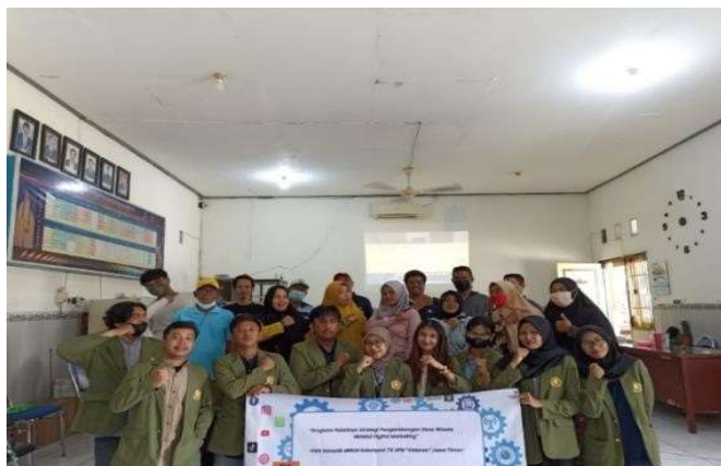
Gambar 4. Kegiatan Pelatihan Digital Marketing

Pelatihan ini dilaksanakan secara komprehensif dari pengunggahan produk, penerimaan pesanan dari pembeli, pengiriman produk kepada pembeli, hingga akhirnya peserta yang merupakan penjual dapat berhasil menerima uang dari proses penjualan online ini.