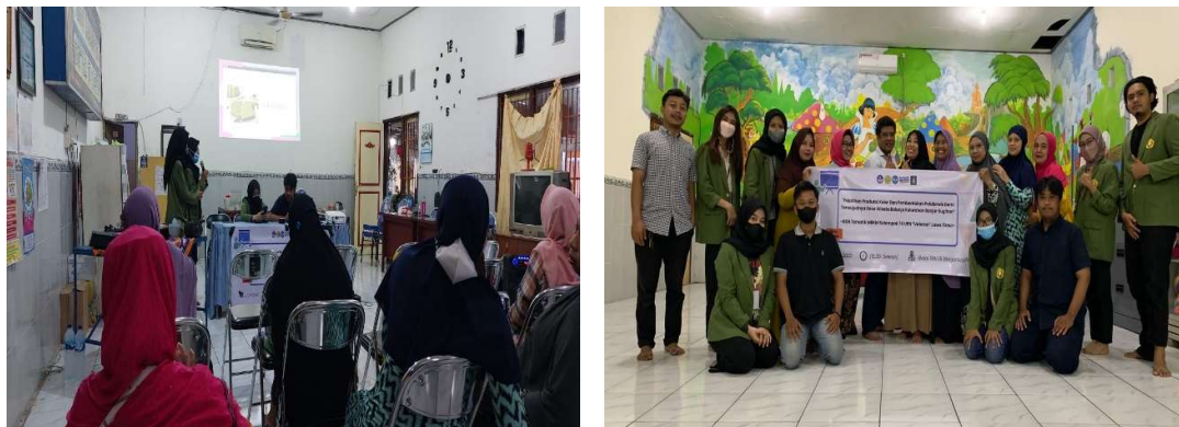
Gambar 3. Kegiatan Pembentukan Pengurus dan POKDARWIS

Selain dibentuknya pengurus e-commerce , tim KKN Tematik Kelompok 74 UPN Veteran Jawa Timur yang bekerjasama dengan masyarakat Kampung Kelor juga membentuk kelompok sadar wisata atau Pokdarwis yang merupakan salah satu organisasi berbasis masyarakat dan bertujuan untuk membantu pemerintah dalam melaksanakan sosialisasi serta implementasi unsur-unsur pesona dalam kegiatan kepariwisataan. Hal ini bertujuan untuk meningkatkan daya saing wisata daerah Kampung Kelor serta sebagai upaya perwujudan dan pengembangan sadar wisata di daerah Kampung Kelor.