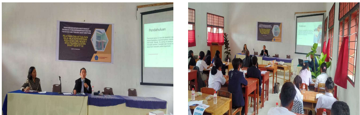
Gambar 2. Penyampaian Materi I “Pelatihan Jiwa Kepemimpinan pada Siswa”