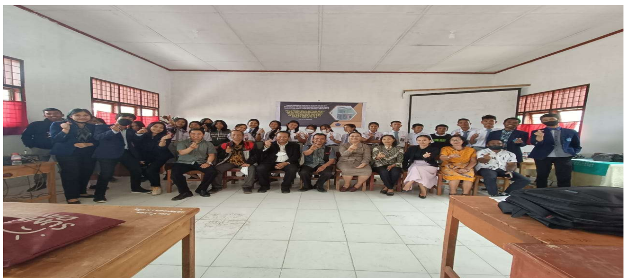
Gambar 8. Foto Bersama di akhir kegiatan Pengabdian kepada Masyarakat (PkM).