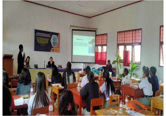
Gambar 4. Sesi Tanya Jawab Materi I