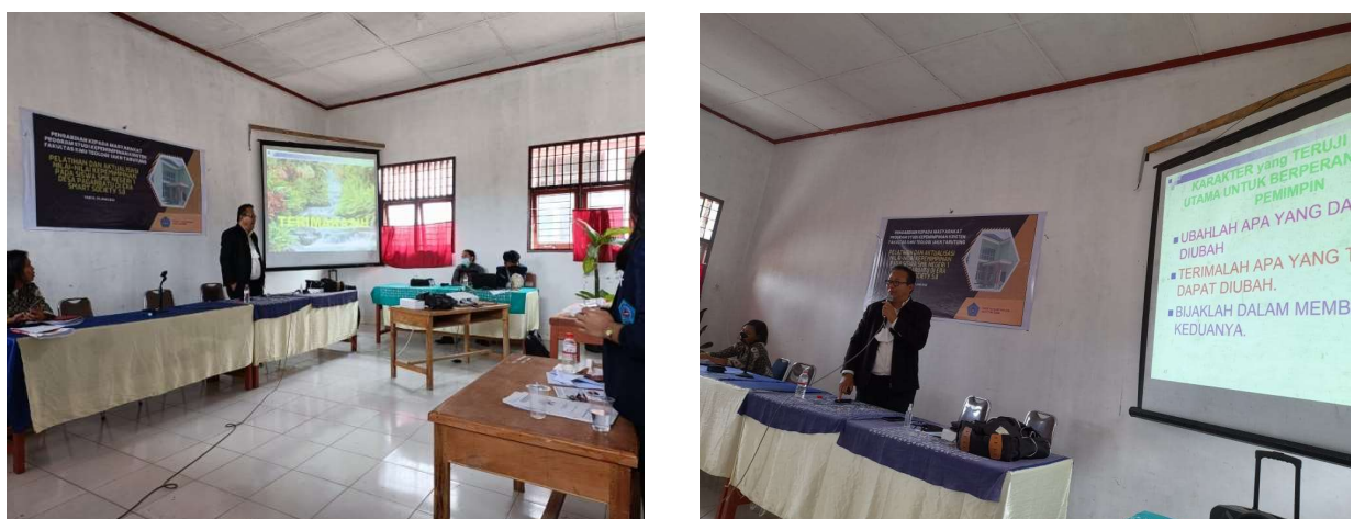
Gambar 3. Penyampaian Materi II “Aktualisasi Nilai-nilai Kepemimpinan pada siswa di Era Smart Society 5.0”