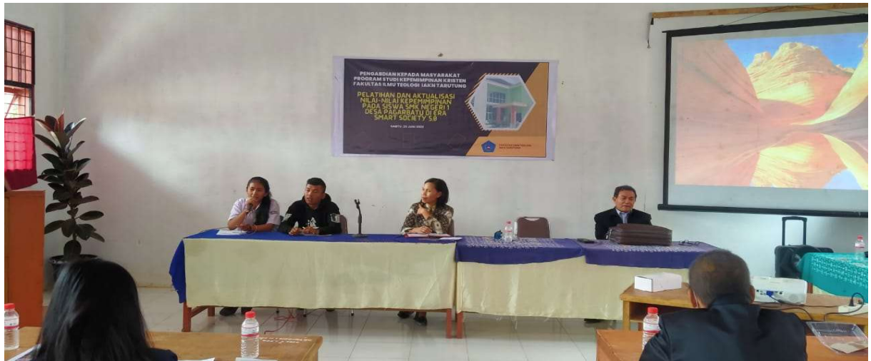
Gambar 6. Simulasi Rapat Organisasi Siswa Intra Sekolah (OSIS) dengan topik “Pentas Seni memperingati Hari Kemerdekaan 17 Agustus”