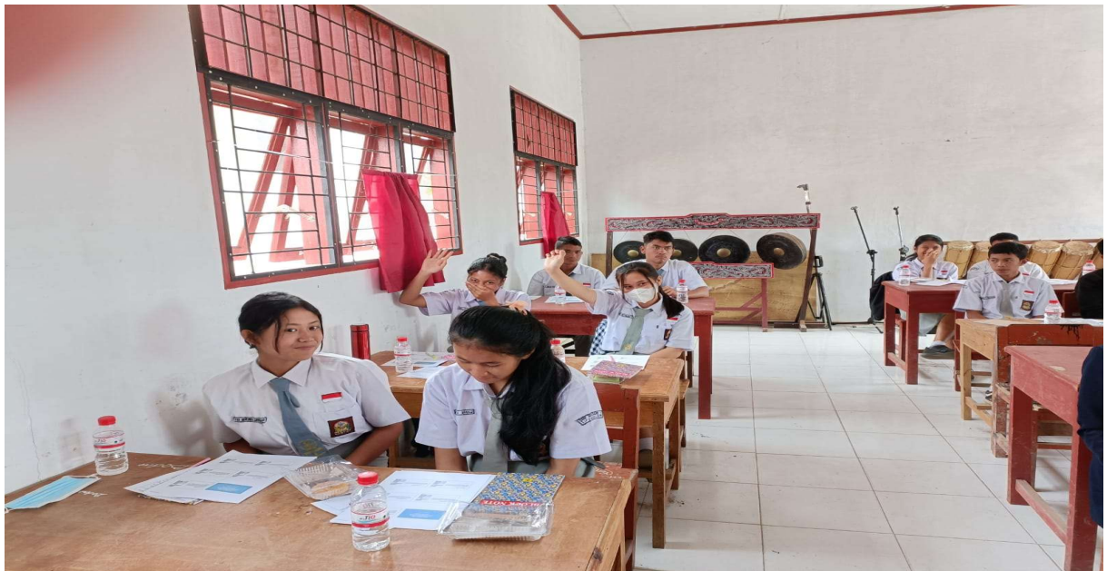
Gambar 5. Sesi Tanya Jawab Materi II