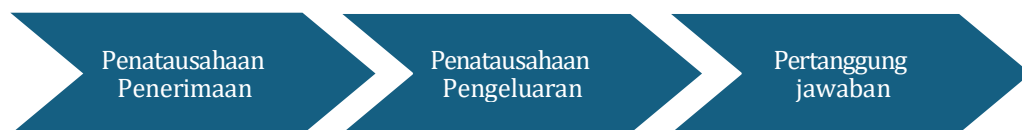
Gambar 4. 2 Penatausahaan Keuangan Kampung Kelitu Sintep